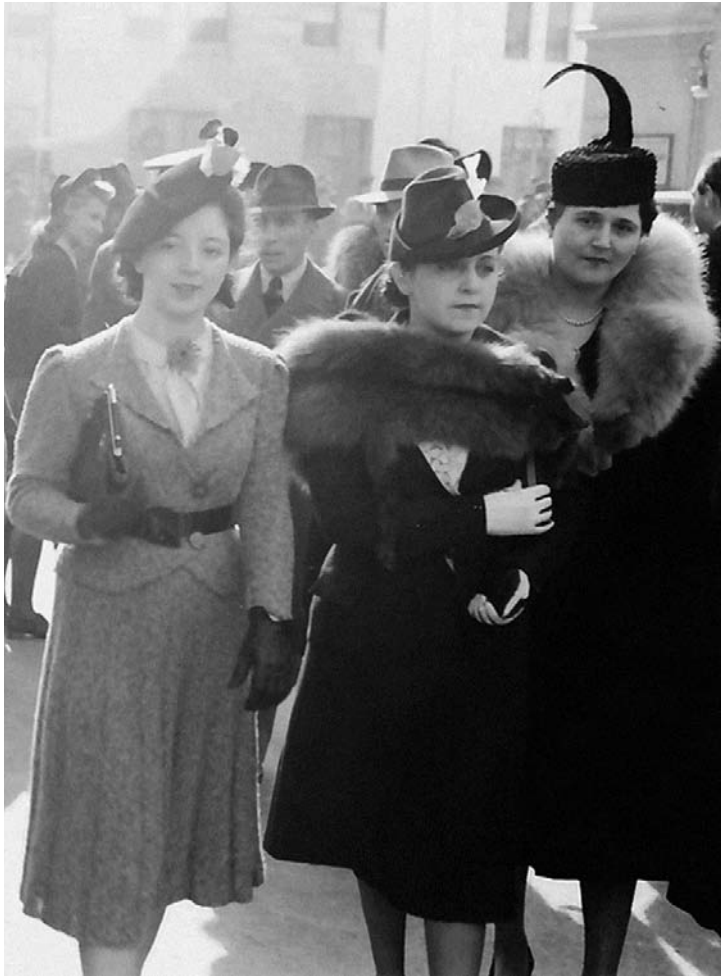
Plimbare pe Calea Victoriei, octombrie 1939.