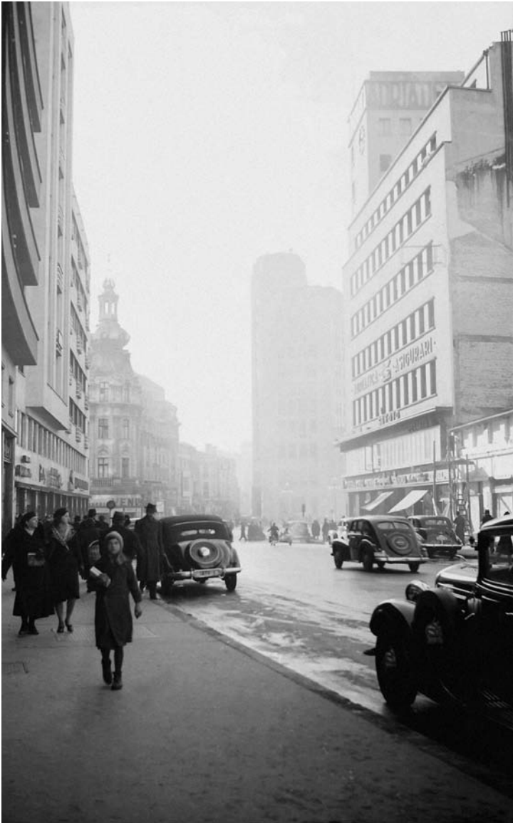
Calea Victoriei, în dreptul Palatului Telefoanelor, februarie 1941.