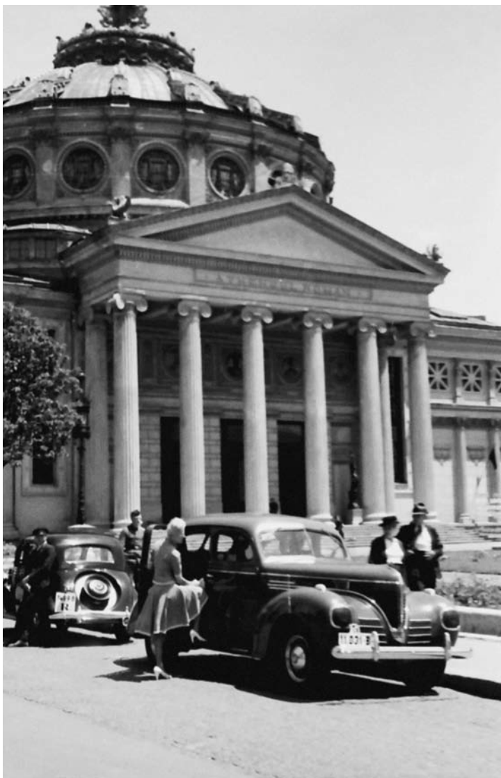
În fața Ateneului Român, iunie 1941.