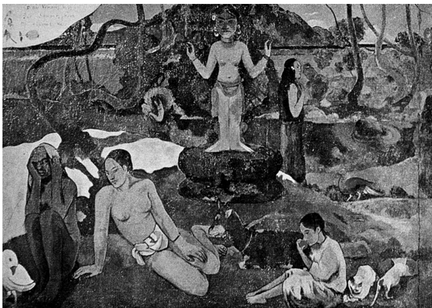
Paul Gauguin, D'où venons nous? / Que sommes-nous? / Où allons-nous? (1897–1898), ulei pe pânză, Museum of Fine Arts, Boston, Massachusetts