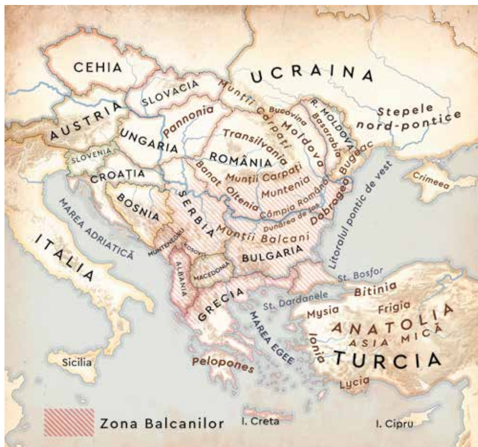
EUROPA DE SUD-EST cu granițele actuale și diversele denumiri geografice, noi sau antice, folosite în text.

Istoricii fac mereu distincția între civilizația grecească și, apoi, cea romană din jurul Mării Mediterane, pe de o parte, și popoarele din afara acestui spațiu, așa-numiții barbari, pe de altă parte. Azi, noi numim barbar pe cineva necioplit, grosolan sau brutal. În trecut, grecii i-au numit barbari pe cei ce vorbeau limbi străine, de neînțeles pentru ei. Barbarul era străinul ne-grec. Aici intrau și fenicienii, egiptenii sau latinii din Italia. Romanii au preluat termenul, dar i-au dat un sens mai restrâns. Pentru romani barbarii nu mai erau cei de altă limbă (și în niciun caz popoare precum egiptenii sau grecii), ci popoarele din afara lumii elenistice și romane – în special neamurile de dincolo de hotarele imperiului. Această lume, indiferent de neam, a primit și un nume: Barbaricum , „lumea barbară“.