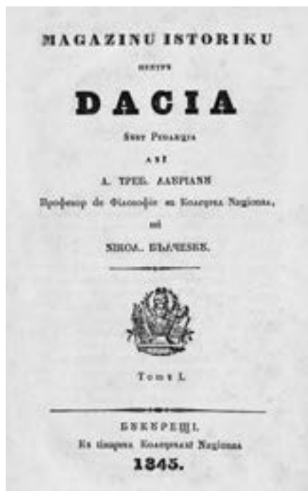
Magazin istoric pentru Dacia, sub redacția lui August Treboniu Laurian și Nicolae Bălcescu, 1845.

A doua mare sfidare a secolului al XIX-lea a fost problema modernizării , în fapt a occidentalizării societății românești. Renunțarea la orientalismul și tradiționalismul scrisului și vestimentației însemna, fără îndoială, o apropiere de modelul occidental, dar greu rămânea de făcut. Întrebarea era cum puteau fi puse în mișcare un sistem patriarhal și autoritar, o societate covârșitor rurală, dominată de marea proprietate și aproape lipsită de fermentii moderni ai capitalismului și democrației. Într-un interval scurt, și cu deosebire în deceniul 1860–1870, tânărul stat român a