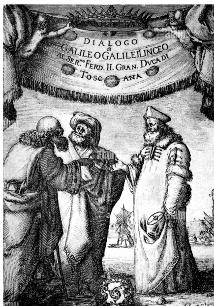
Pagina de gardă a Dialogului lui Galilei

Ambele cărți pun în scenă conversații între un aristotelician-ptolemeic (Simplicius), un copernican-galileian (Salviati) și un moderator (Sagredo), care în prima carte discută despre astronomie, iar în a doua despre mecanică și știința materialelor. Dacă Discursurile conțin legatul științific al lui Galilei și expun descoperirile făcute de el de-a lungul întregii sale cariere, Dialogul constituie maximumul pe care-l poate atinge o carte de popularizare: nu doar pentru stilul autorului, pe care Italo